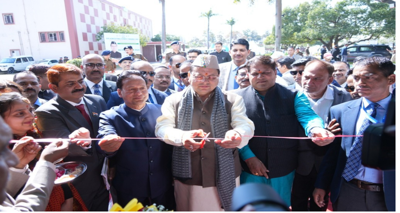
कृषि विज्ञान प्रदर्शनी का उद्घाटन करते माननीय मुख्यमंत्री श्री पुष्कर सिंह धामी।