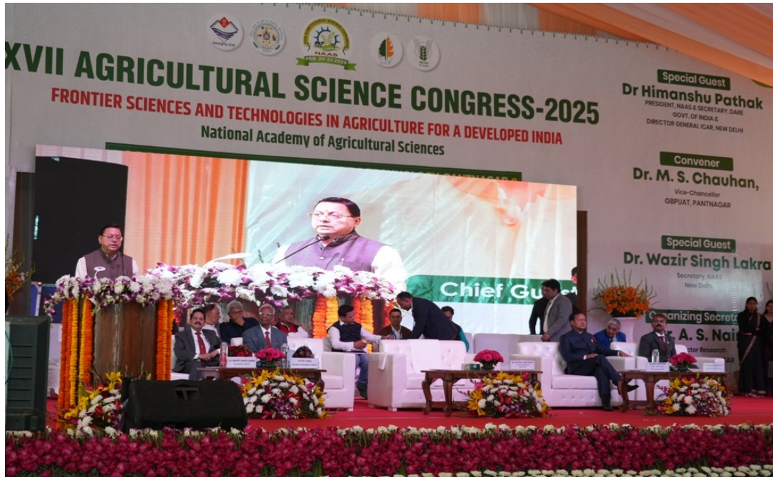
कृषि विज्ञान सम्मेलन को संबोधित करते उत्तराखण्ड के माननीय मुख्यमंत्री श्री पुष्कर सिंह धामी।