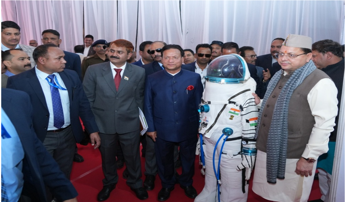
कृषि विज्ञान प्रदर्शनी में रोबोट का अवलोकन करते माननीय मुख्यमंत्री श्री पुष्कर सिंह धामी।